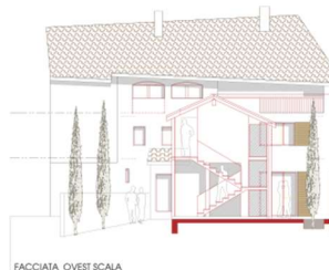
FACCIATA OVEST SCALA