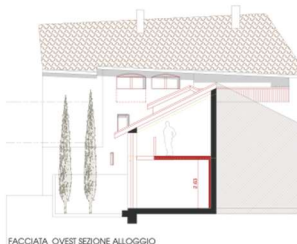
FACCIATA OVEST SEZIONE ALLOGGIO